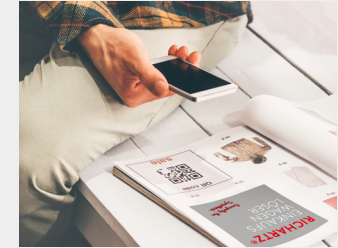
... als Kollektionsartikel