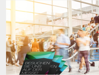
... als Streuartikel