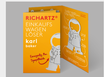
... mit Standardverpackung